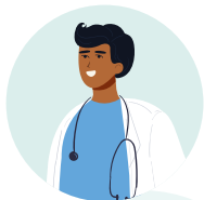
زما د ډاکټر لخوا