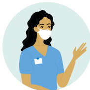
په روغتون کې