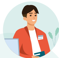
د معاینې مرکز کې یا روغتیایی مرکز کې